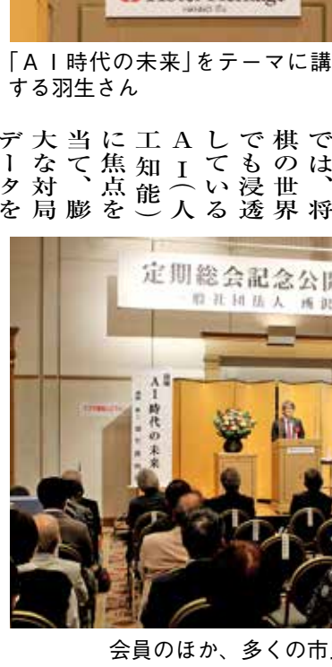
会員のほか、多くの市民が来場した