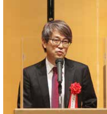
「AI時代の未来」をテーマに講演する羽生さん

一般社団法人所沢人会「AI時代の未来」をテーマに講演を行った。将棋界のレジェンドとして知られる羽生さんの講演で、事前申込を行った多くの市民が会場へ足を運び、熱心に耳を傾けた。 将棋界の活躍を語る羽生さんは、所沢市出身。講演では、将棋の世界でも浸透しているAI(人工知能)に焦点を当て、膨大な対局データを 読み込ませて作られた初期のソフトから、基本的なルールを覚えて自己対局を繰り返すことで勝つ可能性の高い手を自分で学んでいくAIの登場など、驚異的な進化を見せるソフトの世界を紹介。 自身の経験から得た考察 を交えながらAIと人間の違いなどを語り、将棋では直観、先読み、大局観を面を捉え、総合的に判断するなど人間の選択には感情や一貫性、方針を感じさせるのに対して、AIは一手一手の評価の高いものを選択するため一貫性といったものは見えない。だが、最近では人間のような思考を感じさせるAIも登場しつつあり、AIをうまく活用することで、人間が創造性を や発想の幅を広げていくことが大切などと語った。同法人会長は、正しい知識の普及や企業発展などを目的に飯能、入間、狭山、所沢の事業者代表など対組織され、自治体への税に対する提言、児童生徒を対象とした租税教育やコンクールの実施、若手名講師を迎えさまざまなテーマの公開講演会などを開催している。